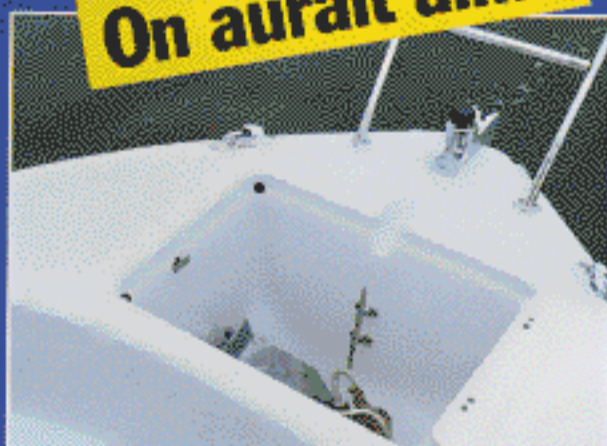
Un guindeau électrique.

d'un agréable salon de pont prévu pour cinq personnes formé avec la banquette transversale, la table de cockpit et le leaning-post du pilote basculé vers l'arrière. Un bain de soleil en quatre parties s'installe sur l'avant pour la sieste d'après déjeuner (641 € en option). En pêche, le pont de type walkaround offre une facilité de circulation pour le suivi des prises et une marche moulée dans le pavois sur les trois quarts avant du bateau permet de monter facilement sur la plate-forme qui reçoit la baille à mouillage. Un haut balcon en inox sécurise ce poste de lancer. La position de conduite est confortable. Le bateau, qui vire quasiment à plat, montre un bon comportement en navigation. Il est peu sensible à la gîte et suit une dérive régulière dans le courant.