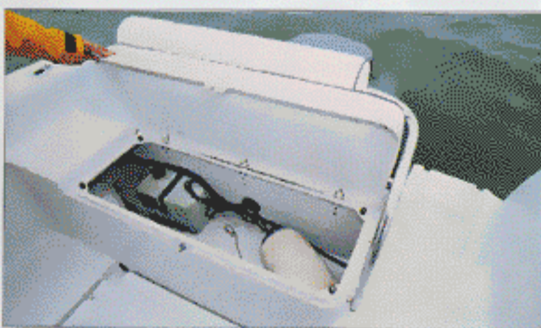
La banquette arrière cache un bel espace de rangement.