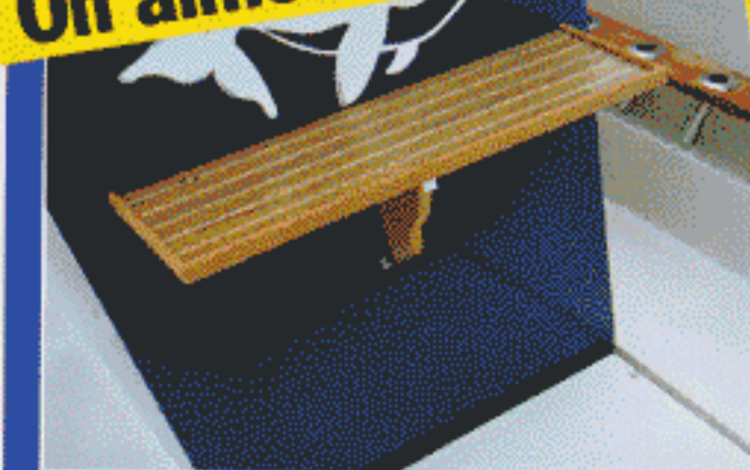
La table de découpe.