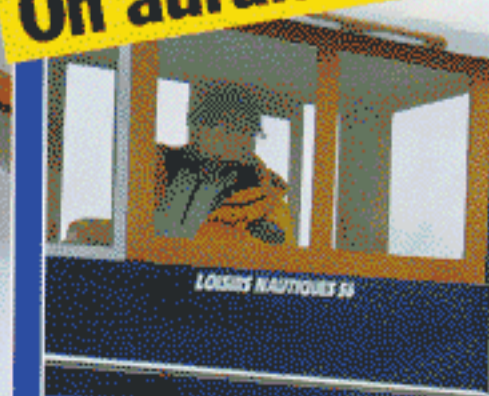
Une fenêtre coulissante dans la timonerie.